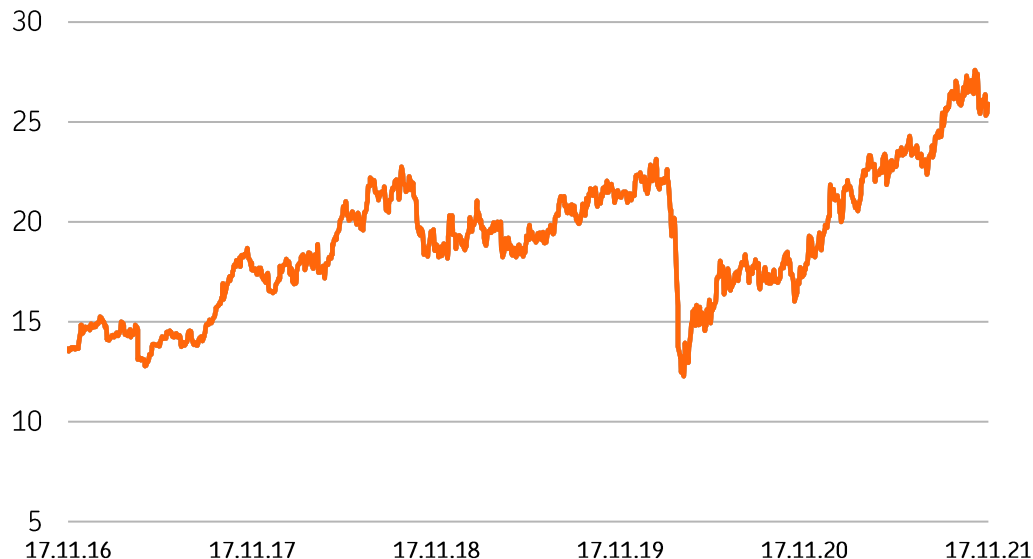
Fortum Oyj kurssikehitys 17.11.2016–17.11.2021

Yhtiöllä on noin 20 000 työntekijää, jotka toimivat 40 maassa. Yhdessä tytäryhtiönsä Uniperin kanssa Fortum on Euroopan kolmanneksi suurin CO 2 -päästöttömän sähkön tuottaja. Vuonna 2020 Fortumin liikevaihto oli yli 49 miljardia euroa ja liikevoitto 1599 miljoonaa euroa.