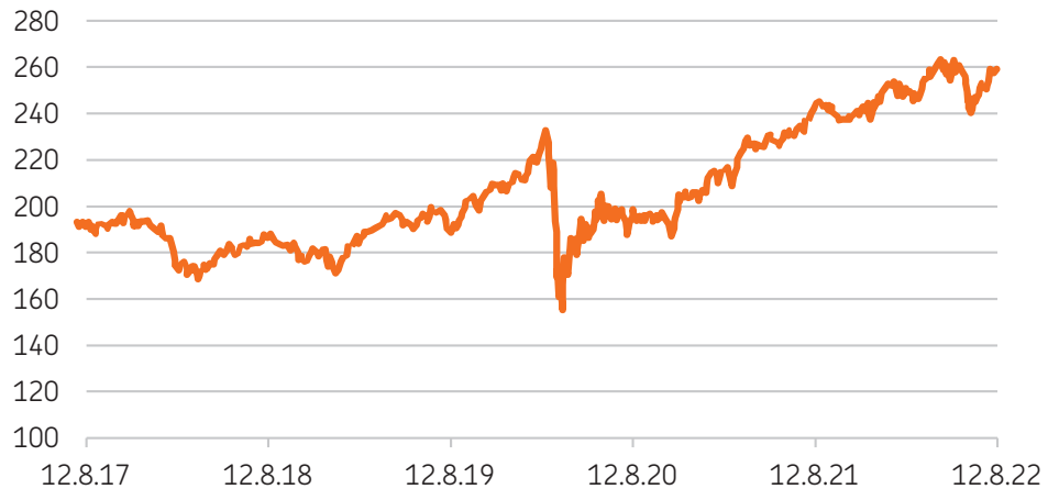
Kohde-etuutena olevan osakeindeksin kurssikehitys 12.8.2017–12.8.2022

Kurssikehityskuvaaja havainnollistaa kohde-etuutena olevan osakeindeksin historiallista arvonkehitystä edeltävältä viideltä vuodelta. Historiallinen kehitys ei ole tae tulevast.