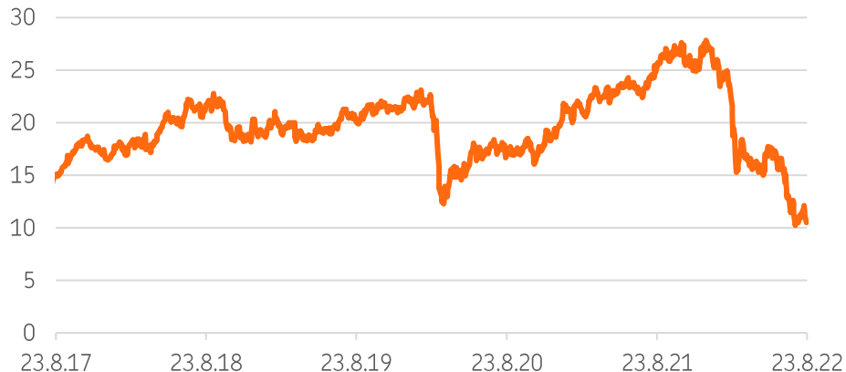
Fortum kurssikehitys 23.8.2017–23.8.2022

Yhtiöllä on noin 20 000 työntekijää, jotka toimivat 40 maassa. Yhdessä tytäryhtiönsä Uniperin kanssa Fortum on Euroopan kolmanneksi suurin CO 2 -päästöttömän sähkön tuottaja. Yhtiön sähköntuotannosta 40 % oli hiilidioksidipäästötöntä vuonna 2021. Vuonna 2021 Fortumin liikevaihto oli yli 112 miljardia euroa ja liikevoitto 2536 miljoonaa euroa.