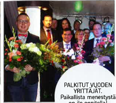
PALKITUT VUODEN YRITTÄJÄT. Paikallista menestystä on ilo onnitella! Marraskuu 2018.