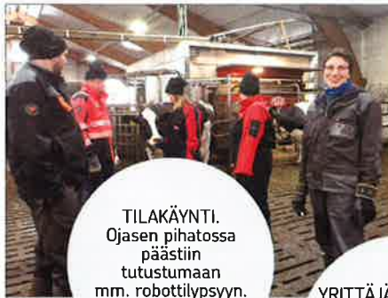
TILAKÄYNTI. Ojases pihatossa päästiin tutustumaan mm. robottilypsyyn. Lokakuu 2018.