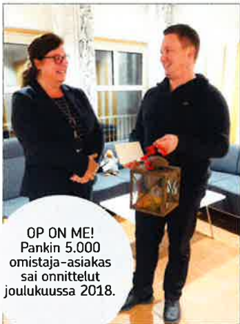
OP ON ME! Pankin 5.000 omistaja-asiakas sai onnitellut joulukuussa 2018.