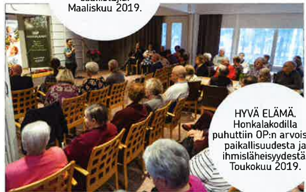
HYVÄ ELÄMÄ. Honkalakodilla puhuttiin OP:n arvoista, paikallisuudesta ja ihmisläheisyydestä. Toukokuu 2019.