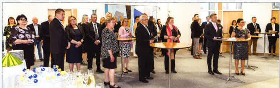
Pankin hallinto ja henkilöstö kokoontuivat juhlimaan 95-vuotiaasta osuuspankkia. Laaja hallinto ja sitoutunut henkilöstö ovat olleet pankin tärkeä menestystekijä läpi vuosikymmenten. Toukokuu 2019.