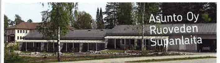
Kuvassa jo valmis As Oy Ruoveden Suppa.

Tutustu Mobiilivaimoon op.fi-palvelussa: https://uusi.op.fi/verkkopalveluiden-kaytto/mobiilivain