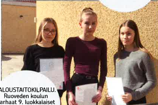
TALOUSTAITOKILPAILU. Ruoveden koulun parhaat 9. luokkalaiset talousosaajat palkittiin OP:lta. Huhtikuu 2019.