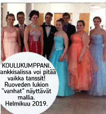
KOULUKUMPPANI. Pankkialissa voi pitää vaikka tanssit! Ruoveden lukion "vanhat" näyttävät mallia. Helmikuu 2019.