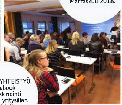
YRITTÄJÄYHTEISTYÖ. Facebook -markkinointi kiinnosti yritysillan osallistujia. Maaliskuu 2019.