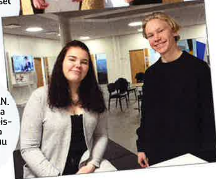
#HYVÄ KIERTÄMÄÄN. Lukion oppilaskunta sai OP:lta tukea yhteisen henkeä edistävään toimintaan. Joulukuu 2018.